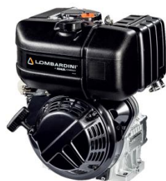
Moteur diesel LOMBARDINI –15LD350