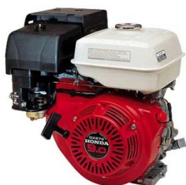
Moteur essence 4 temps HONDA GX270