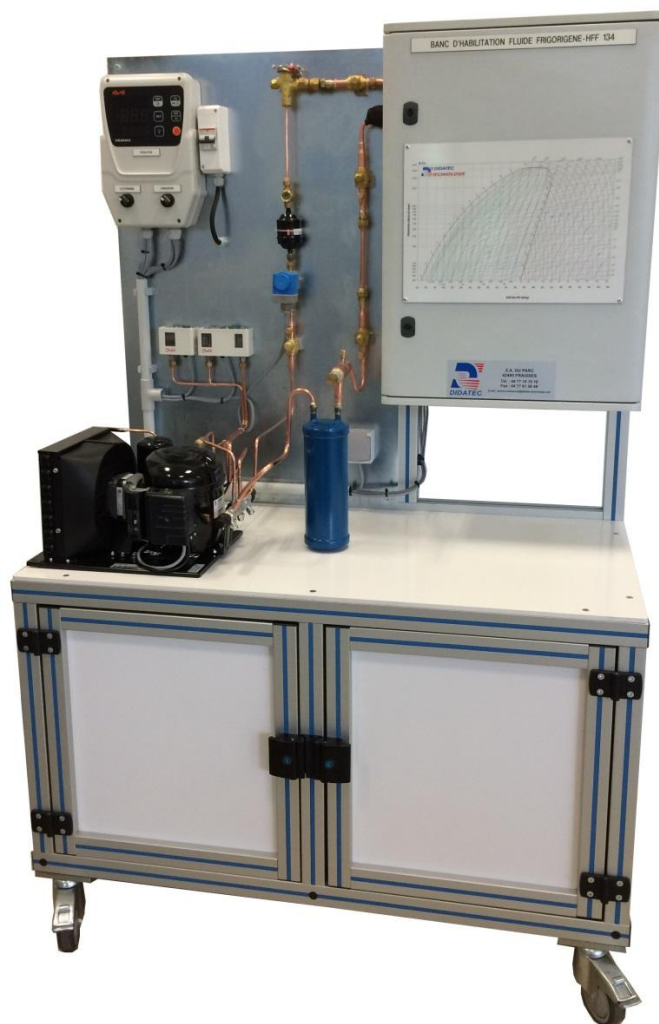
Exemple de réalisation